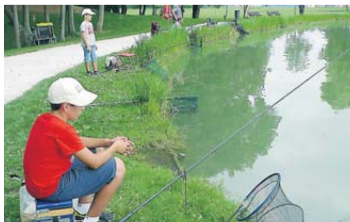
Des jeunes pêcheurs autour du lac François-Soula.

Plus de 2 300 pêcheurs sont aujourd'hui adhérents de l'AAPPMA (Association Agréée pour la Pêche et la Protection du Milieu Aquatique) Plaisance, Fonsorbes, La Salvetat, Colomiers et d'autres peuvent les rejoindre. En effet une des missions de l'AAPPMA est de promouvoir la pêche à la ligne pour le plus grand nombre et d'assurer l'initiation aux techniques. Ainsi l'« Atelier Pêche Nature » autrement dit l'« École de Pêche » fait, dès la mi-septembre, sa rentrée. Elle est ouverte aux enfants à partir de 7 ans et aux adultes. L'apprentissage est assuré par un guide pêche diplômé et des bénévoles passionnés par la pêche aux poissons blancs, qui transmettent leurs solides connaissances en matière de pêche au coup à la Roubaissienne et au Feeder, ainsi qu'à la pêche du carnassier au leurre. Lors des séances, qui se déroulent les mercredis après-midi, à Fonsorbes au lac de Bidot, ou à Plaisance-du-Touch au lac François Soula, de 13h45 à 17h, le matériel est fourni par