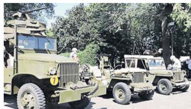
Évocation de 2 de Guerre Mondiale au parc Duroch.